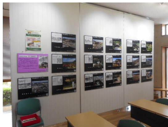
水戸市立内原図書館にて