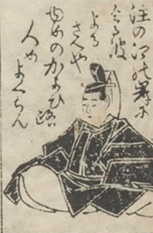
十八 在京敏行胡氏