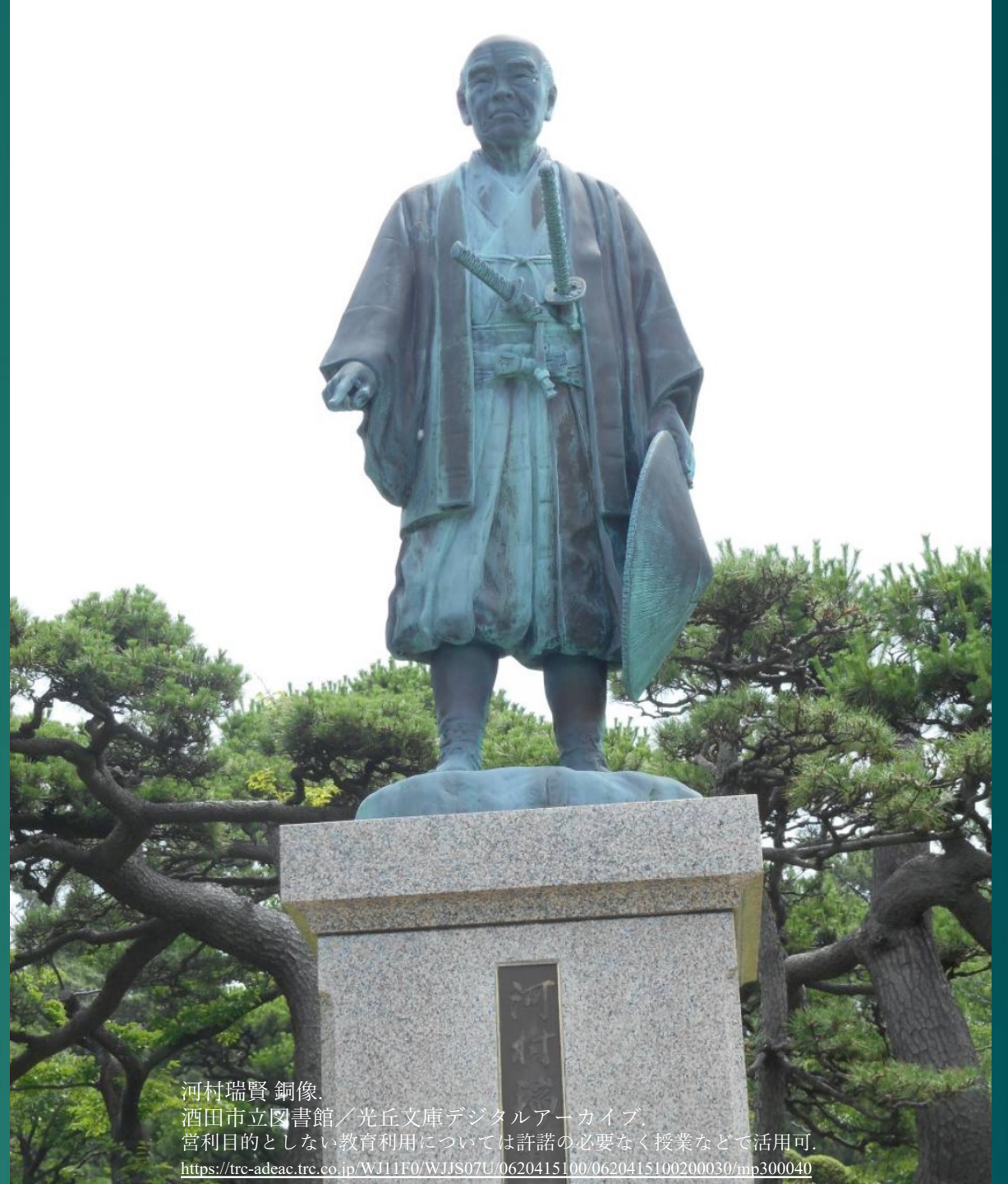
河村瑞賢 銅像. 営利目的としない教育利用については許諾の必要なく授業などで活用可. https://trc-adeac.trc.co.jp/WJ11F0/WJJS07U/0620415100/0620415100200030/mp300040