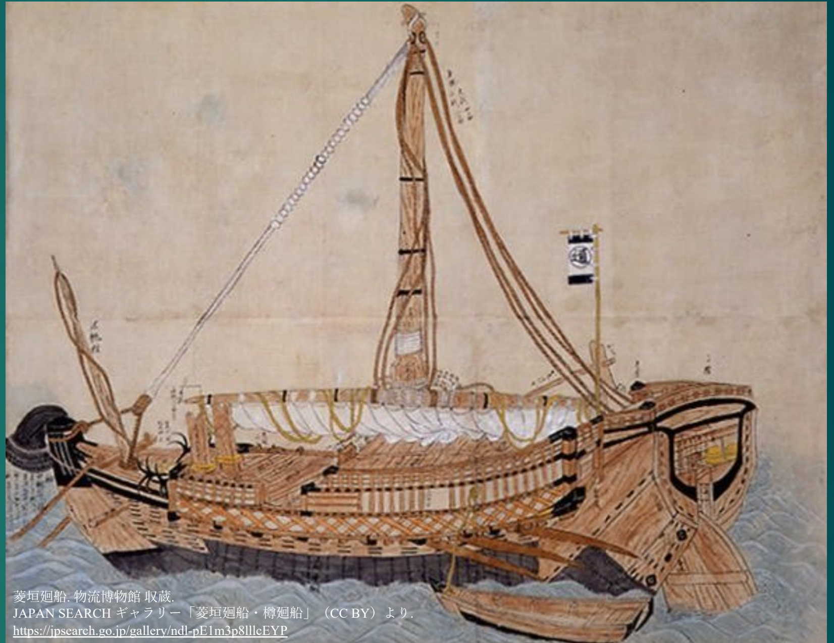
菱垣廻船. 物流博物館 収蔵. JAPAN SEARCH ギャラリー「菱垣廻船・樽廻船」(CC BY) より. https://jpsearch.go.jp/gallery/ndl-pE1m3p8lllcEYP