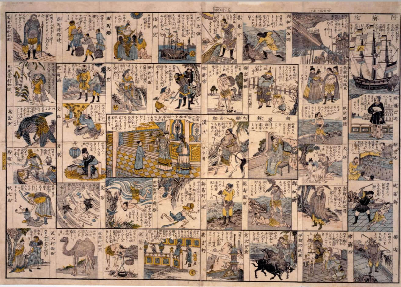
東京学芸大学教育コンテンツアーカイブ「世界巡り双六」 https://d-archive.u-gakugei.ac.jp/item/18505892