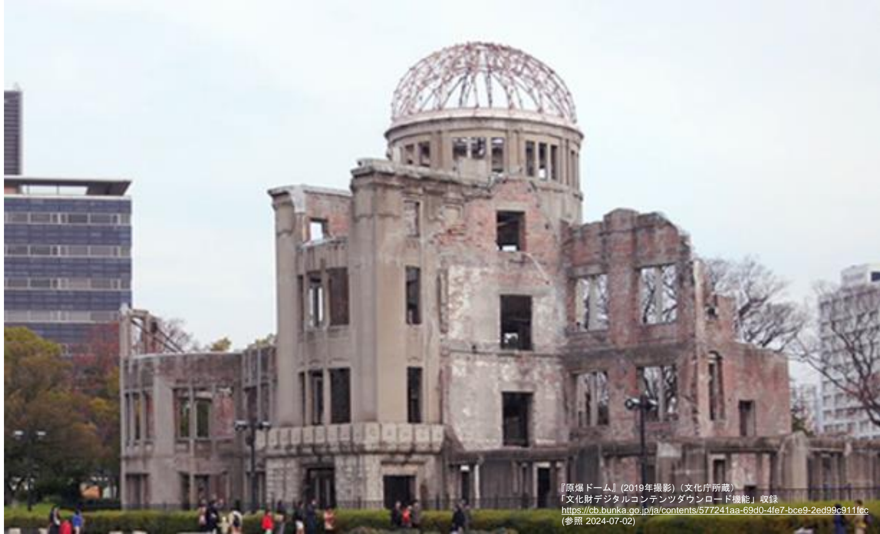
『原爆ドーム』(2019年撮影)