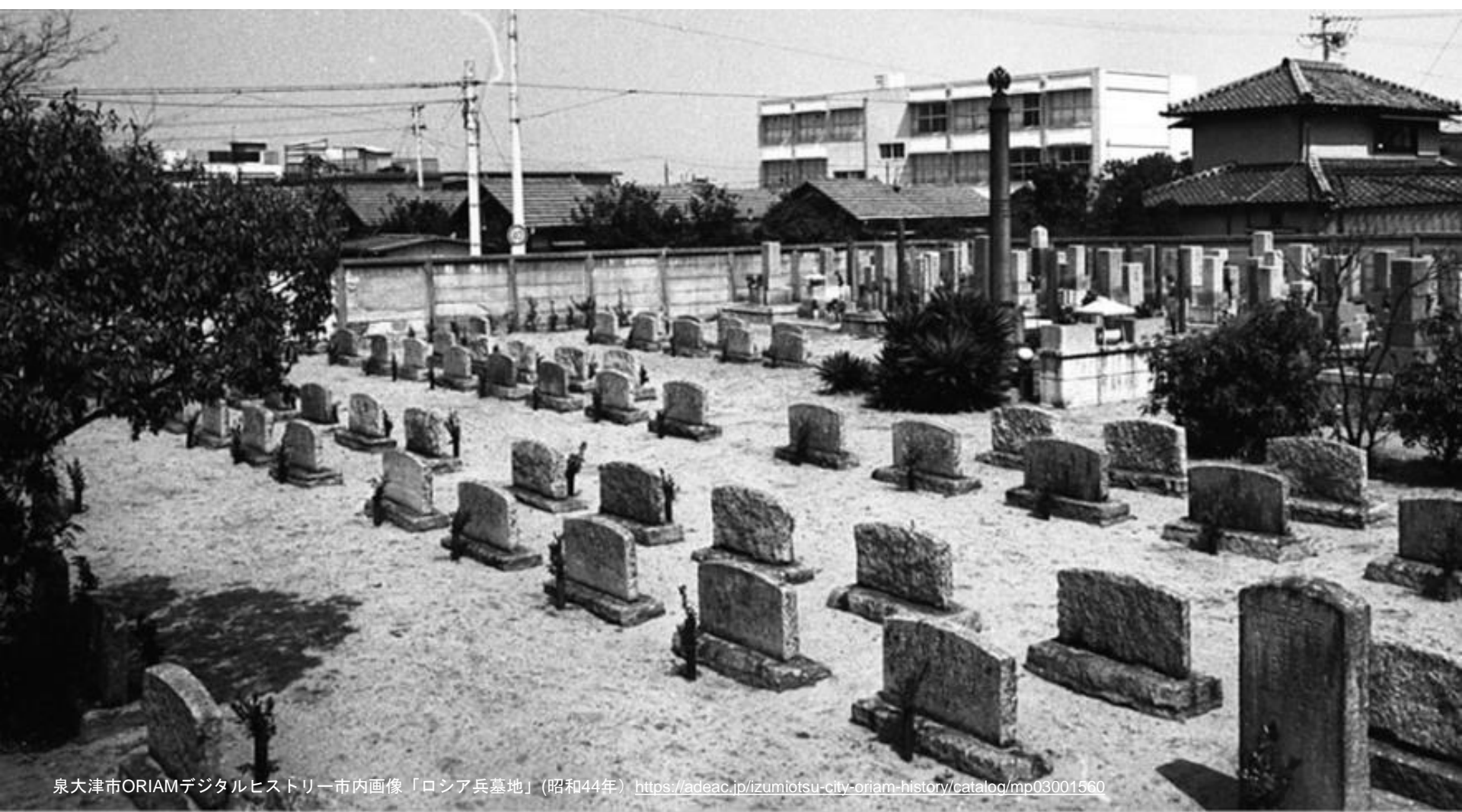
泉大津市ORIAMデジタルヒストリー市内画像「ロシア兵墓地」(昭和44年) https://adeac.jp/izumiotsu-city-oriam-history/catalog/mp03001560