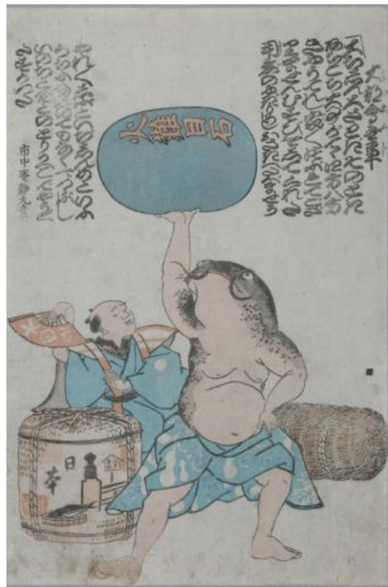
長野市立博物館所蔵：「瓦版 大都会無事」 https://adeac.jp/nagano-city/catalog/mc00001199