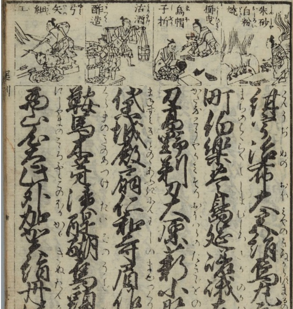
庭訓往来 絵詳解 弘前図書館所蔵. CC BY. https://rc-adeac.trc.co.jp/WJ11F0/WJIS07U/0220205100/0220205100200010/mp000151

問い 江戸時代以前、中世における京と津軽地域・夷島との交易はどのような実態だったのだろうか？