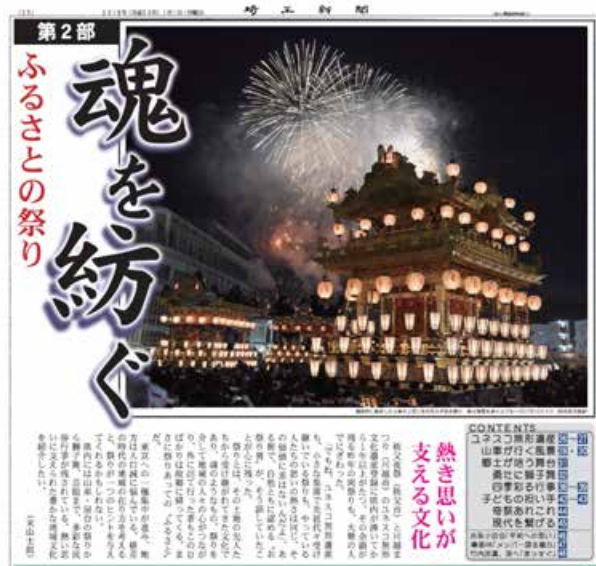
『埼玉新聞』2018年（平成30年）1月1日