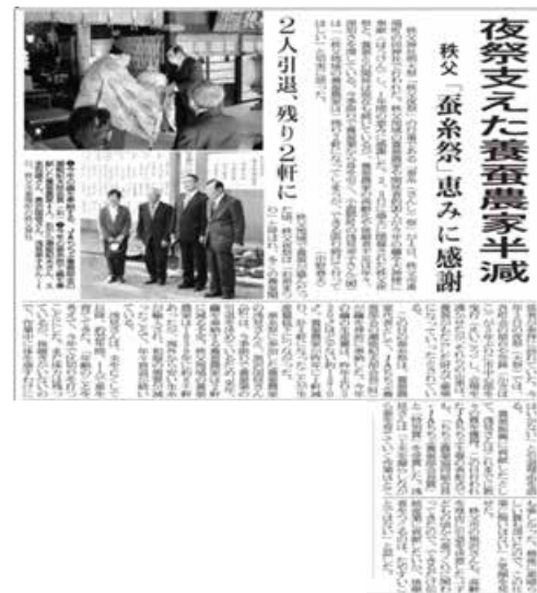
『埼玉新聞』2022年（令和4年）12月5日