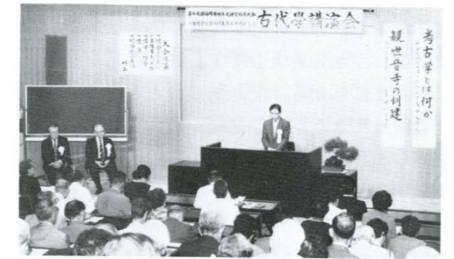
地方史研究協議大会

昭和42年10月、福岡県文化会館において第1回福岡県地方史研究協議大会が開催され、小倉郷土会・田川郷土研究会・福岡地方史談話会・三池史談会・美夜古文化懇話会・浮羽郷土研究会等県内各郷土会が参集し、県下各郷土会を結集した組織を模索することになりました。約1年間準備の後、44年2月15日、第2回大会