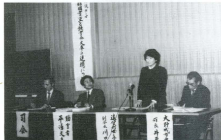
読書活動研究集会

本会の設立目的は、公民館相互の連絡提携を密にしながら、県立図書館貸出文庫の有効適切な活用をはじめ、公民館図書室の運営に関する調査研究と各種図書事業の企画・実施を通じて地域の教育文化の発展に寄与するところにあります。具体的には、公民館図書室