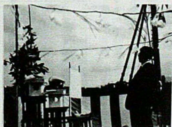
▲工事の無事を祈願する村長

バルコニーを庭先のお縁として田園生活のよさをとり入れ親しい人が直接近づける庭として、近隣のつきあいを大事にした快適な暮ら