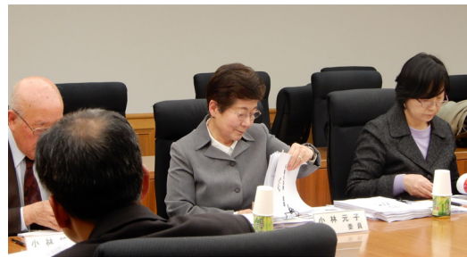
↑原稿を確認している様子

平成30年度第2回港区史編さん委員会が、平成31年3月26日に開催されました。今回の編さん委員会では、令和2年3月に刊行・公開される通史編（原始・古代・中世、近世）、自然編、図説版の構成をはじめ、刊本の装丁をソフトカバーとすることや図説版の概要について議論しました。また、資料編の編さん体制や今後のスケジュールを確認しました。