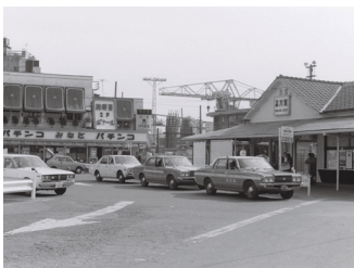
昭和 55 年頃の品川駅