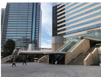
現在の品川駅港南口