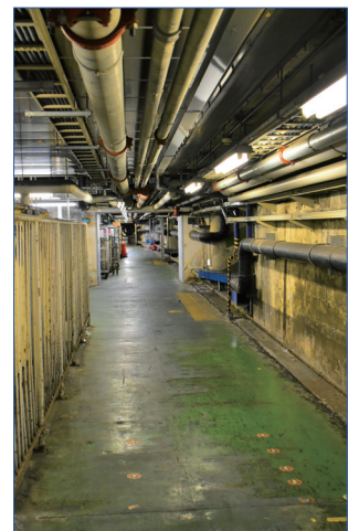
品川駅地下通路の様子

令和元年 9 月 3 日 柄越祥子 近代執筆者 令和元年 10 月 16 日 都倉武之 近代監修・執筆者