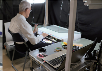
増上寺調査の様子