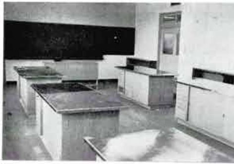
講習室B ガス、水道、調理器具の完備した料理講習むきの部屋

成人学校、青年学級、店員講習技術講習などに使用できる。 講習室A 十八坪 五十席 ガス、調理器具の設備があり料理講習に使用できる 集会室A 五十席 二十・五坪の日本間で、各種の集會に使用できる。 集会室B 十五坪 三十五席 洋間の集會室 屋上には、花だん、保育園用の組立式プールがある。 使用時間 (1) 午前九時から午後五時までを