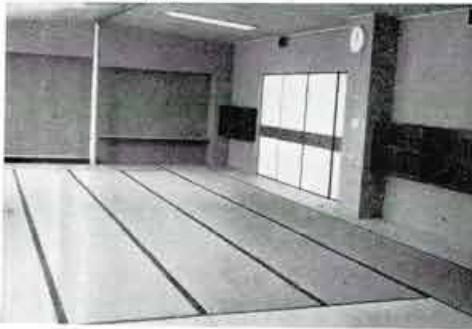
敬老室 午前9時から午後5時まで無料で開放され舞台があっておどりもできます。