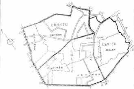
港区内町区域新設略図