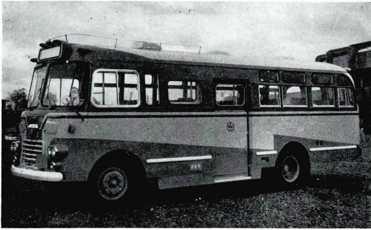
リフトつきのこのバスは、こどもたちの家の近くまで送り迎える。

使用時間と料金 午後五時三十分～九時 和室A(三十二畳) 四百円 和室B(十畳) 百円 使用申込