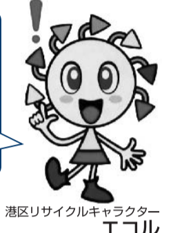
港区リサイクルキャラクター エコル

Reuse (リユース) 「リユース」とは、今あるものを繰り返し利用すること、また本来とは違う用途として使用することです。 ○繰り返し使えるリターナブル品を使いましょう。 ○シャンプー等は詰め替え用を使いましょう。 ○紙はメモ用紙にするなどして裏面も使うようにしましょう。