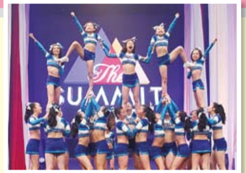
The Summit(チアリーディング国際大会)の様子

芝浦エンジェルスの子どもたちには、チアを通してさまざまなことを吸収してほしいと願っています。特に、返事や挨拶をきちんとすることに関しては、社会に出て大切なことなので、徹底して指導をしています。エンジェルスの活動を通し、子どもたちには地域愛も生まれ、チアで地域を応援しています。地域の協力も得ながら成長して、さらに幅広く活動していきたいと思っています。