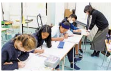
日本語学級の様子

平成3年開設。港区立小学校に通う、日本語能力が十分でない外国人児童・帰国児童に対して、日本語や生活習慣の習得をめざして支援をする学級。