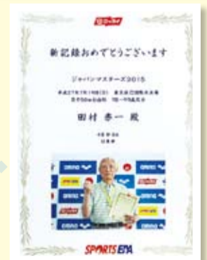
ジャパンマスターズ日本新記録表彰状