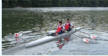
混合ダブルスカル

シングルスカルとダブルスカルの選手は左右にオールを持ち、両手でこぎます。下肢に障害があるシングルスカルの選手は体幹を使えないため、バランスをとりやすくするためにボートのシートは動かず、背もたれと身体をベルトで固定できるように設計されています。ボートの両脇に補助用の浮きがついているのも特徴です。ダブルスカルでは背もたれがなく、体幹を使って