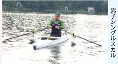
男子シングルスカル