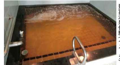
豊富温泉体験(イメージ)