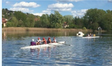
混合舵手つきフォア

2020年の東京大会からコースの競漕距離が2倍の2000メートルに延長されます。選手の力強いパフォーマンスやチームワーク、駆け引き等を楽しみましょう。