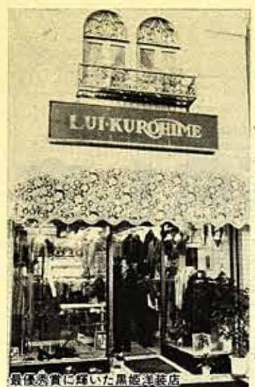
最優秀賞に輝いた黒姫洋装店

コンクールには、区内「王」店の応募があり、審査の結果、次のとおり入賞店が決まりました。 表彰式は、一月三十日に品川区商店街連合会の新年会で行われました。 最優秀賞 黒姫洋装店(大井一五三二五) 優秀賞 ヘアサロン(スラ)北品川一四一七 努力賞 丸大食品(南品川五三二一八) 若菜園(東中延二一〇一) 日之出写真商会小山三二二一〇 喜久寿司(小山三二二一〇) 成瀬写真館(大井一五三二五)