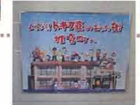
H24.11月 椎名町駅舎壁画