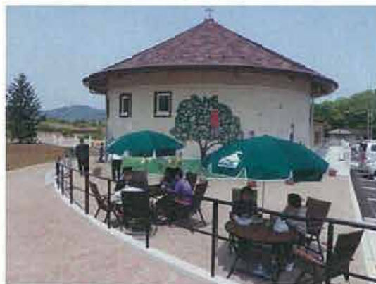
“里の駅アグリン館”