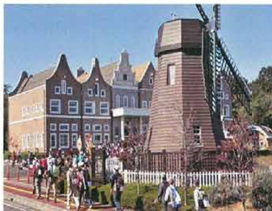
“日本スリーデーマーケット”