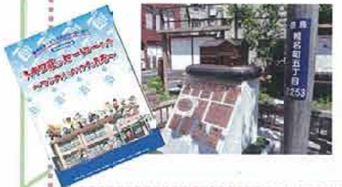
記念碑 (南長崎花咲公園内)