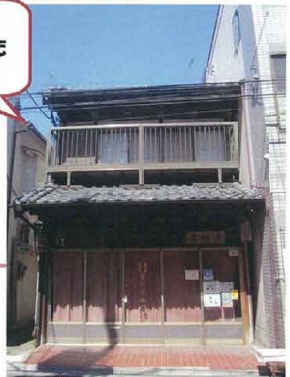
往時の面影を残す 昭和レトロな雰囲気!