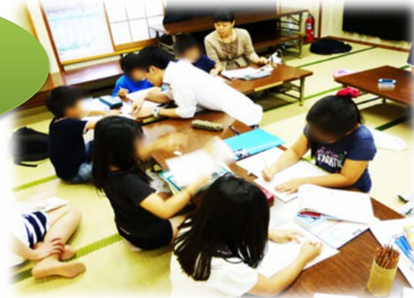
としま子ども学習支援ネットワーク(とこネット)