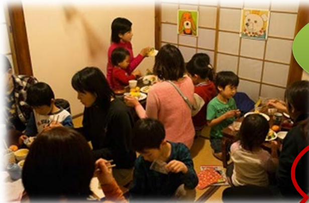
要町あさやけ子ども食堂