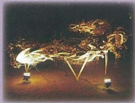
※写真は過去の作品