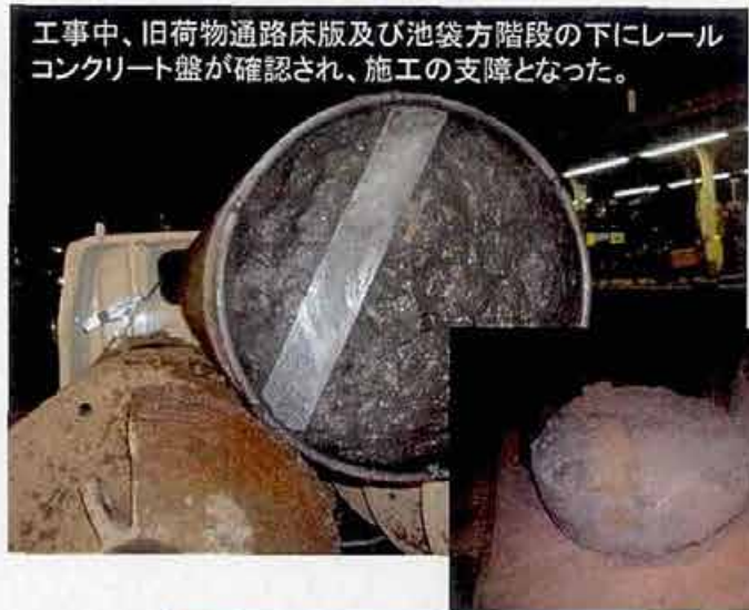
工事桁支持杭支障物撤去