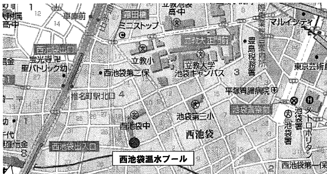
【西池袋温水プール位置図】