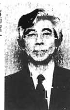
講師紹介：昭和12年長野県生まれ。東京大学文学部卒業。NHK国際語学英米科卒業後、NHKに入社。現在はNHK国際語学英米科講師。NHK国際語学英米科講師。NHK国際語学英米科講師。

1982年7月2日、豊島区は、世界の恒久平和への願いを込め、23区で初めての「非核都市宣言」を行いました。以来、このつどいは区民の皆さんとともに平和の尊き、核兵器の恐ろしさを考えました。今年も講演と映画を通して、平和を考えたと思います。多数の方の来場をお待ちしています。