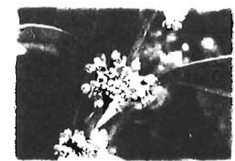
学名 Osmanthus fragrans var. aurantiacus 分類 モクセイ科モクセイ属

秋風によって、南長崎公園や南池袋公園などから、この花の甘い香りが漂ってきます。中国原産の常緑小高木で、9月下旬から10月上旬に、葉の付け根部分に橙色の5mmほどの小さな花をたくさんつけます。雌雄異株で、日本には雄株しかないため実をつけません。