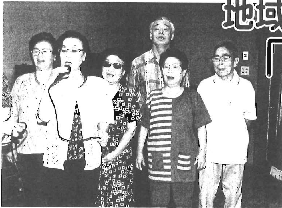
カラオケを楽しむ利用者(駒込ことぶきの家)

発行：東京都豊島区 編集：政策経営部広報課 〒170-8422 豊島区東池袋1-18-1 ☎3981-1111(代表) ホームページ http://www.toshima.ne.jp/~city/