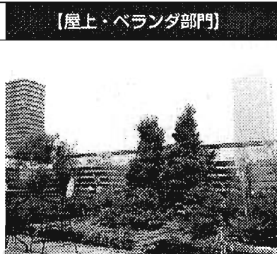
【屋上・ベランダ部門】

屋上の花壇には四季折々の花が咲くように、工夫するようにしています。子どもや孫たちが集まり、15人くらいでバーベキューをやって楽しんでいます。夜になると、サンシャインの景色は、赤・黄・青などの光が灯り、すばらしい100万ドルの夜景に変貌します。とても居心地の良い空間です。