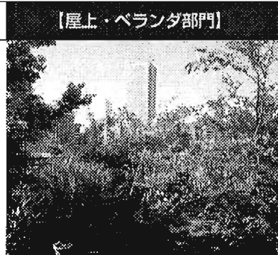
【屋上・ベランダ部門】

里山風に、自然のままを再現したいと思いました。キキョウなどの野草や、つる性の植物を多く育てています。また、スイレンやハスなど、水生の植物も植えたかったため、池も作りました。池の中には、ボウフラを防止するため、金魚も泳いでいます。