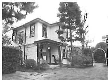
▲雑司が谷旧宣教師館(そしがやきゅうせんきょうしんかん)

①高田・雑司が谷編…11月15日(土)、②駒込・巣鴨編…11月22日(土) ①②とも午後2～4時◇現在に重なる江戸時代の古道を歩きながら、区内の文化財を巡る◇集合場所…参加者に直接連絡◇20名※両日参加できる方◇200円(保険料)往復はがき(8面下部記入例参照)で、11月5日(必着)までに教育総務課文化財係(あて先上部欄外参照)へ。 豊島文化財係 ☎3981 - 1190