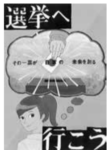
▲平成29年度豊島区中学生の部最優秀賞作品

◇応募資格…区内在住、在学の小・中学校、高等学校の児童・生徒📄郵送か持参で9月7日(必着)までに当事務局へ。 📄当事務局 ☎4566-2821